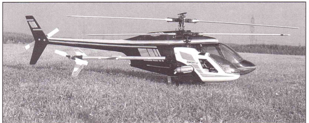
Star Ranger und Concept 30 im Größenvergleich.

blättern läuft. Anstelle unserer gewohnten durchgehenden Blattlagerwelle gibt es hier zwei getrennte, so daß sich ein stabiles und relativ weiches Flugverhalten ergibt. Die kollektive Pitchsteuerung geschieht durch Verschieben des Kompensators mittels zweier Schubstangen, die durch das Gelenklager der Taulmscheibe führen. Dadurch braucht die Hauptrotorwelle keine Führungsnut, was der Festig-